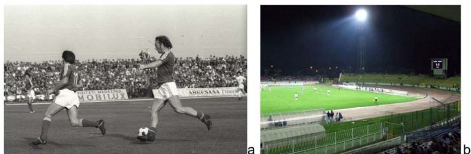
Fig. 8. Pitești. Stadionul „1 Mai” (astăzi „Nicolae Dobrin”). Anii '70 ai secolului XX: tribunele arhipline, la un meci în care evolua Nicolae Dobrin (a). Astăzi: în tribunele stadionului modernizat, cu instalație de nocturnă, vin din ce în ce mai puțini spectatori (b).