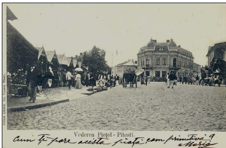
Fig. 3. Pitești. Piața Episcopiei (carte poștală, circa 1920). Colecția Muzeului Județean Argeș. După S. Cristocea, E. Rotaru și R. Maschio.

(În plan apropiat, bustul lui Gh. Ionescu-Gion, dezvelit în 1911 în fața Palatului Administrativ, amplasat pe la începutul anilor '30 ai secolului XX într-un spațiu lateral, la sud-est de palat (imaginea de aici), iar în 1966 dislocat din Grădina Publică și amplasat în curtea Liceului Nicolae Bălcescu (Colegiul Brătianu); în stânga, Palatul Administrativ (astăzi Muzeul Județean Argeș); în plan îndepărtat, una din turlele Bisericii Sfântul Nicolae și Sfântul Pantelimon, demolată în anul 1962).