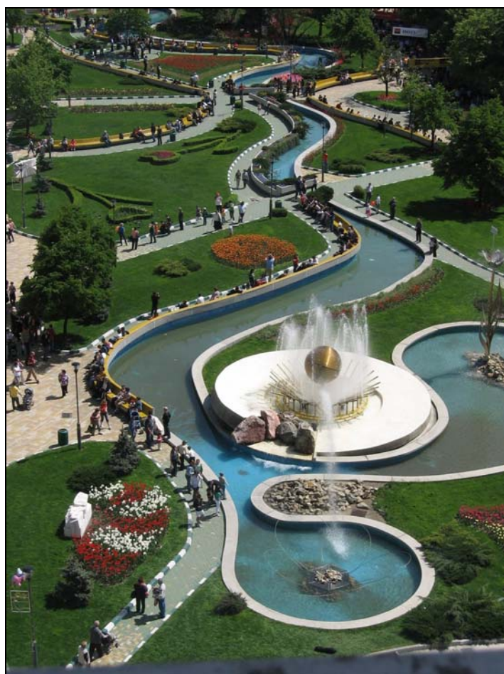
Fig. 9. Pitești. Noul spațiu de promenadă din centrul orașului, inaugurat în anul 2003.