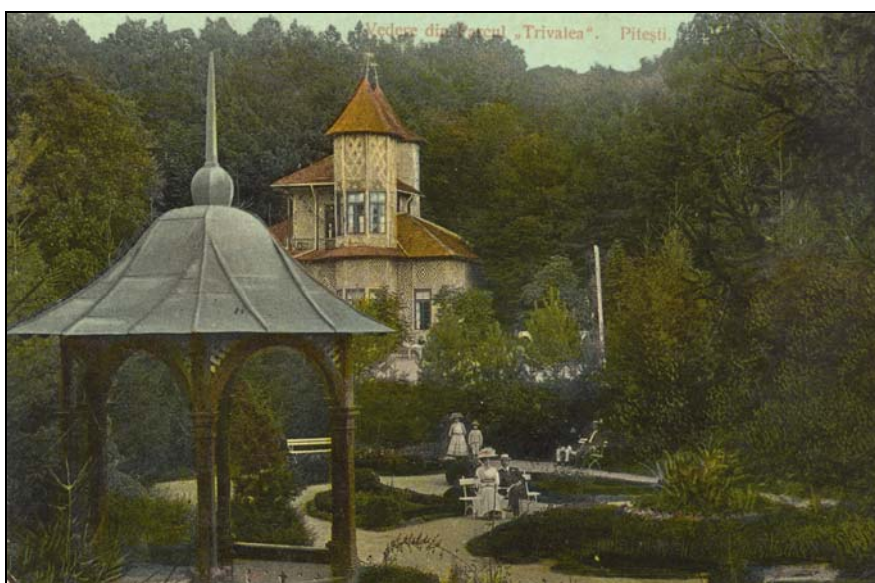
Fig. 5. Pitești. Parcul Trivalea (carte poștală ilustrată, circa 1910). Colecția Muzeului Județean Argeș. După S. Cristocea, E. Rotaru și R. Maschio.