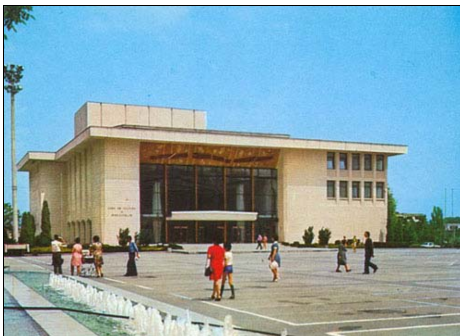
Fig. 7. Pitești. Casa Sindicatelor. Carte poștală ilustrată, la scurtă vreme de la inaugurare (1971).