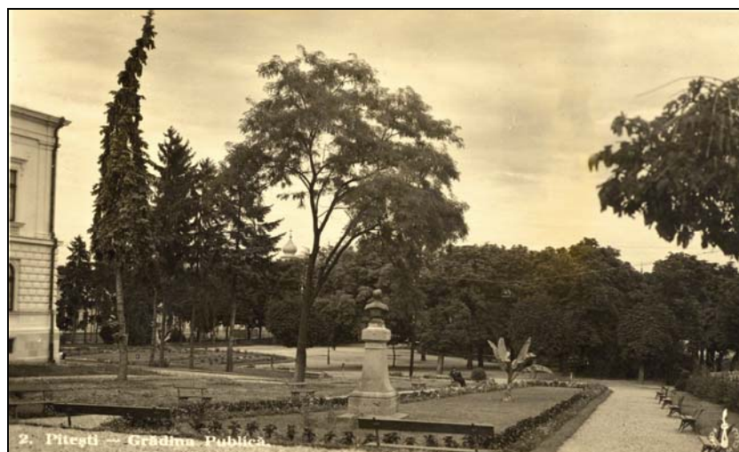
Fig. 2. Pitești. Grădina Publică (carte poștală, circa 1935).

(În plan apropiat, bustul lui Gh. Ionescu-Gion, dezvelit în 1911 în fața Palatului Administrativ, amplasat pe la începutul anilor '30 ai secolului XX într-un spațiu lateral, la sud-est de palat (imaginea de aici), iar în 1966 dislocat din Grădina Publică și amplasat în curtea Liceului Nicolae Bălcescu (Colegiul Brătianu); în stânga, Palatul Administrativ (astăzi Muzeul Județean Argeș); în plan îndepărtat, una din turlele Bisericii Sfântul Nicolae și Sfântul Pantelimon, demolată în anul 1962).