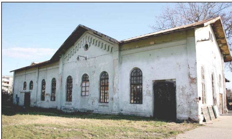
Fig. 4. Pitești. Sala de spectacole Uklăr (Universala Lehrer), transformată în 1912 în fabrică de butoaie (foto Alexandru Oprea, 2006). După S. Cristocea, E. Rotaru și R. Maschio.