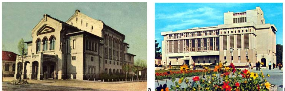
Fig. 6. Pitești. Teatrul. Carte poștală ilustrată din perioada interbelică (a) și vedere recentă (circa 1980) cu înfățișarea actuală, după restaurarea din 1977-1979 (b).