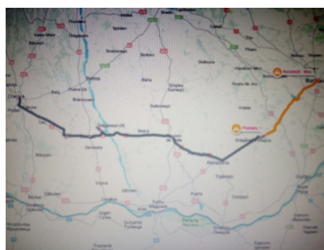
Traseu 3: Craiova – Bucuresti