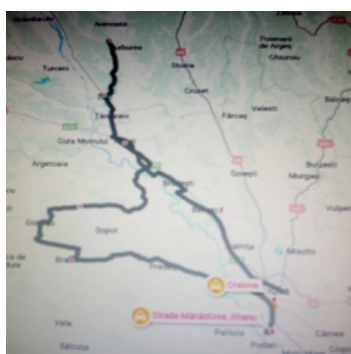
Traseu 2: Craiova – Craiova