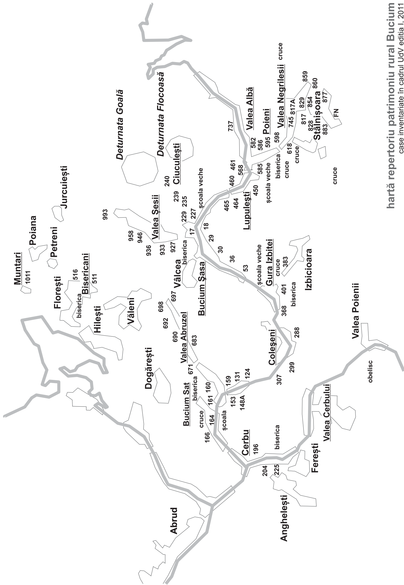
hartă repertoriu patrimoniu rural Bucium case inventariate în cadrul UdV ediția I, 2011