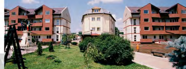
Palat Sud - Iasi