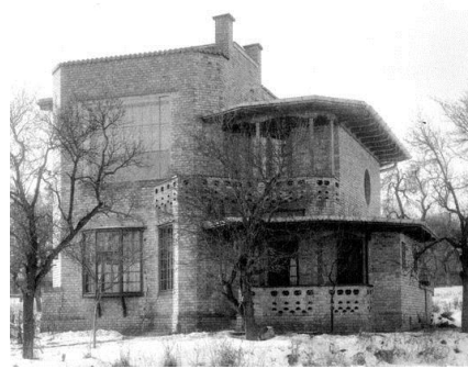
Schiță clădire / în prezent casă memorială István Medgyaszay