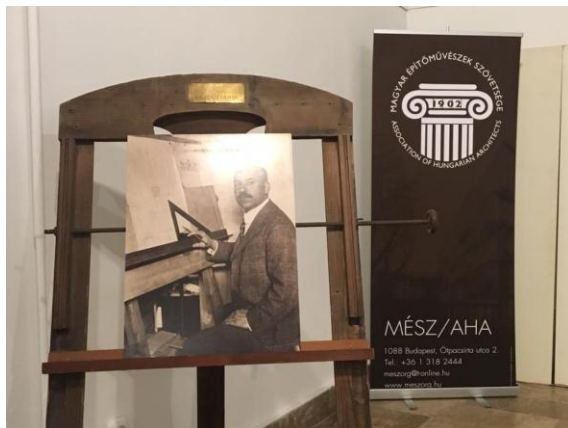
Imagini din expoziția itinerantă din Ungaria

Evenimentul poate fi completat de proiecția filmului documentar regizat de Duló Károly despre viața și activitatea lui István Medgyaszay.