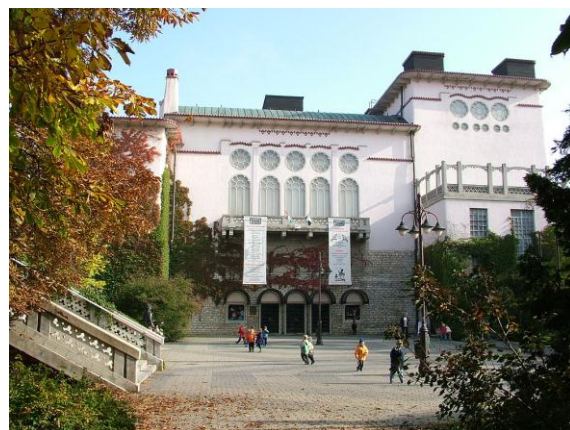
Teatrul din Veszprém