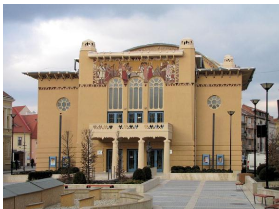
Teatrul din Sopron

În 2017 s-au împlinit 140 de ani de la nașterea sa și a fost comemorat cu mai multe expoziții dedicate activității sale, iar în 2018 urmează să fie expusă o expoziție itinerantă în mai multe locații din România.